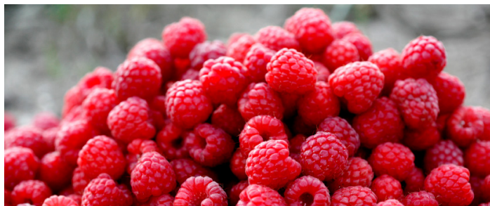
'Glen Ample' PBR E