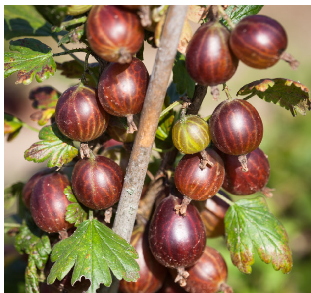
'Martlet' E