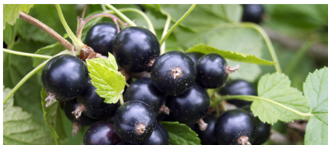
PETTER ® E