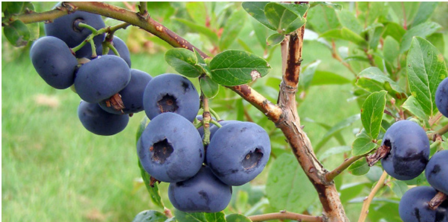
PELLE™ E