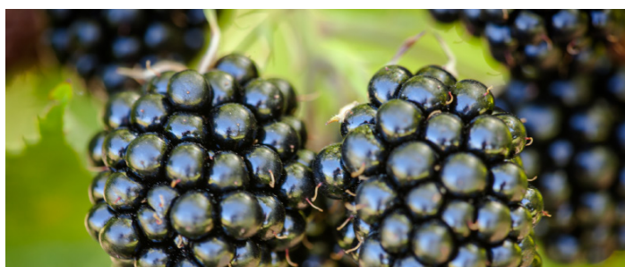
'Loch Tay' PBR E